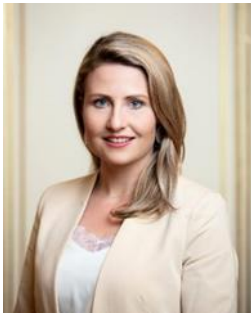
MMag.a Dr.in Susanne Raab

Ich bedanke mich herzlich beim Dachverband Vernetzter Opferschutz und Opferschutzorientierte Täterarbeit und allen an diesem Vorhaben Beteiligten für das große Engagement und diese wichtige Grundlage für die weitere Zusammenarbeit. Durch Ihre tägliche Arbeit leisten Sie einen wesentlichen Beitrag nicht nur auf Einzelfallebene, sondern auch auf gesellschaftlicher Ebene, um weitere Gewalt gegen Frauen und Mädchen zu verhindern.